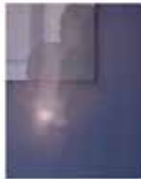
Das Bild zeigt das Profil eines Menschen, der nach rechts blickt. Ein helles Licht im Hintergrund erzeugt einen Glanz auf der Haut.