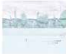
Das Bild zeigt eine weite, offene Fläche, die von einem Gebäude im Hintergrund begrenzt ist. Die Szene ist hell und wirkt wie ein sonniger Tag.