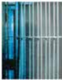
Close-up of a blue and white striped fabric.