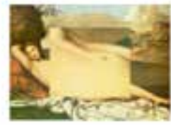
A person lying on a bed, wearing a white sheet.