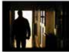
Silhouette of a person standing in a doorway, looking out.