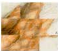
Close-up of a textured, brownish surface, possibly a wall or fabric.