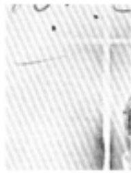
Close-up of a white fabric with a dark, repeating pattern.