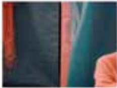
Close-up of a person's shoulder and arm in a red and blue garment.