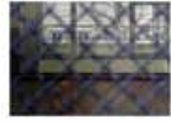
Close-up of a blue and white patterned fabric.