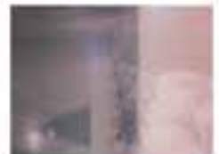
Das Bild zeigt das Profil eines Menschen, der nach rechts blickt. Ein helles Licht im Hintergrund erzeugt einen Glanz auf der Haut.