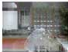
A person sitting on a bench outdoors, looking towards the camera.