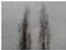
Das Bild zeigt zwei hohe, dünne Strukturen, die wie Bäume oder Kunstwerke aussehen könnten. Sie stehen vor einem hellen Hintergrund.