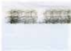
Das Gebäude ist ein Beispiel für die Verwendung von Glas in der Architektur. Die Reflexionen auf der Glasfassade zeigen die Umgebung und den Himmel.