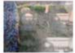
Das Bild zeigt einen Gartenbereich mit einem Steinweg, einer kleinen Fontäne und grünen Pflanzen. Die Szene ist ruhig und idyllisch.